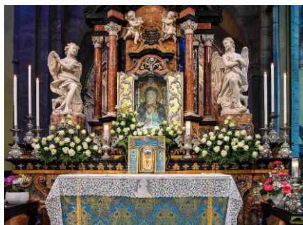
Madonna del Sangue a Re