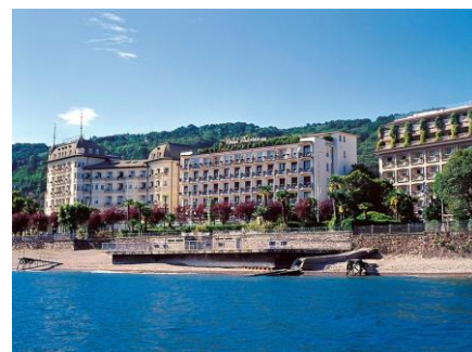
Lungo Lago Maggiore a Stresa