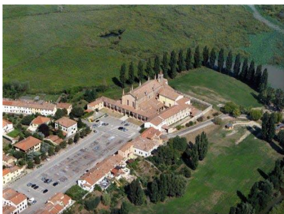
Il Santuario di Curtatone

Quota di iscrizione 55 euro (comprendente viaggio e pranzo). Iscrizioni in sacrestia della Basilica e/o nelle segreterie parrocchiali entro domenica 3 marzo (o fino ad esaurimento dei posti).