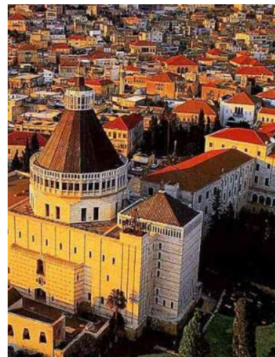
Basilica dell'Annunciazione a Nazareth

Colazione. Mattinata interamente dedicata alla visita dei luoghi intorno al "Mare di Galilea" – il lago di Tiberiade: Santuario delle Beatitudini, Tabgha (Santuario della moltiplicazione dei pani con meravigliosi mosaici bizantini e Chiesa del Primato di Pietro); Cafarnaon (scavi dell'antico villaggio con i resti della casa di Pietro e la Sinagoga del VI sec). Pranzo in ristorante. Rientro a Nazareth e percorso nella città della Sacra famiglia con la Basilica dell'Annunciazione e gli scavi dell'antico villaggio, il Museo francescano, la Chiesa di San Giuseppe. Cena e pernottamento.