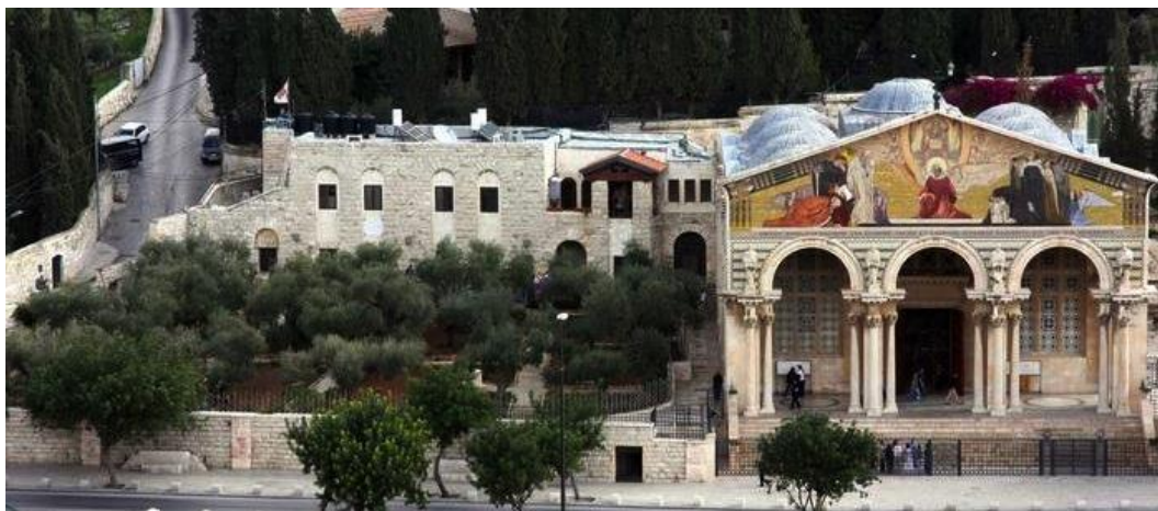
Basilica dell'Agonia a Gerusalemme

Colazione. In mattinata trasferimento a Emmaus Latroun , monastero dei Trappisti – celebrazione Eucaristica conclusiva. Proseguimento per Jaffa, pranzo in ristorante. Breve trasferimento all'aeroporto di Ben Gurion di Tel Aviv, disbrigo delle formalità d'imbarco. Partenza per l'Italia con volo di linea. Dopo il ritiro bagaglio sistemazione sul pullman e rientro in Parrocchia con pullman riservato.